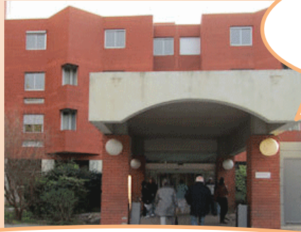
Le CHU de Nîmes